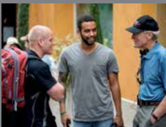
THE 15:17 TO PARIS (15:17 POUR PARIS)

Toutes les informations sur inspire74.com