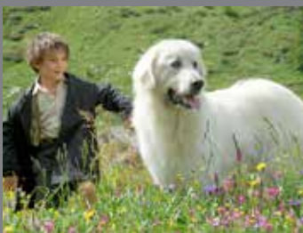
BELLE ET SÉBASTIEN 3 : LE DERNIER CHAPITRE AVANT PREMIÈRE LE 31/01 ET LE 04/02